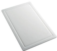
Tagliere in HDPE 8657 001